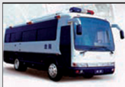
Chinese “bus des doods”

http://www.organharvestinvestigation.net/