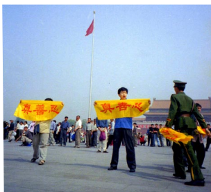
Kineski praktikanata protestuju na Trgu Nebeskog Mira u Pekingu sa transparentima na kojima piše: Istinitost, Dobroдушnost i Tolerancija.

Falun Dafa praktikanata u Kini trpe državni teror već pet i po godina. Uprkos tome, oni se služe isključivo mirnim metodama u svojim apelima i nastojanjima da kinesku i svetsku javnost informišu o nepravednom progonu, kojem su izloženi.