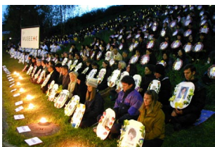
Mirovni apel u Ženevi 2001.

36 Falun Gong praktikanata iz 10 različitih zemalja apeluju na Trgu Nebeskog Mira za zaustavljanje brutalnog progona Falun Gong praktikanata u Kini.