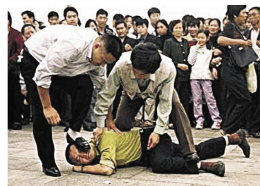
Policijski uhapšeni Falun Gong praktikanata na Trgu Nebeskog Mira u Pekingu

Teško da je neko mogao verovati da će Falun Gong upravo zbog svoje omiljenosti biti progonejen, ali upravo to se desilo u Kini. Nakon što se broj Falun Gong praktikanata u Kini popeo na više od 100 miliona i time prevazišao broj članova komunističke partije (oko 60 miliona), bivši kineski predsednik Jiang Zemin je, ljubomorano na veliku popularnost Falun Gong-a, zloupotrebio svoju moć i u julu 1999. godine započeo brutalan progon s ciljem da potpuno uništi Falun Gong.