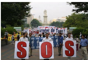
SOS marš u Washingtonu 2001.

Zbog ovakvog odnosa su osnivač Falun Gong-a, g. Li Hongzhi, i Falun Gong praktikanata već tri godine uzastopno nominovani za Nobelovu nagradu za mir, a podrška mirnom otporu Falun Gong praktikanata raste iz dana u dan.