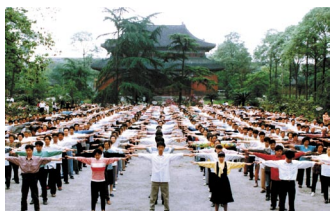
Preko 100 miliona ljudi u Kini upražnjavaju Falun Gong

Zbog nesvakidašnjeg uticaja na zdravlje i činjenice da su sve Falun Gong aktivnosti besplatne, Falun Gong se tokom nekoliko godina proširio u preko 60 zemalja sveta. Prema kineskim medijima, početkom 1999. godine, Falun Gong je upražnjavalo između 70 i 100 miliona ljudi. Falun Gong i g. Li Hongzhi su izvan Kine dobili preko 700 priznanja i povelja. Npr. grad Houston (SAD) je g. Li Hongzhi-ja proglasio "počasnim građaninom" i "ambasadorom dobre volje".